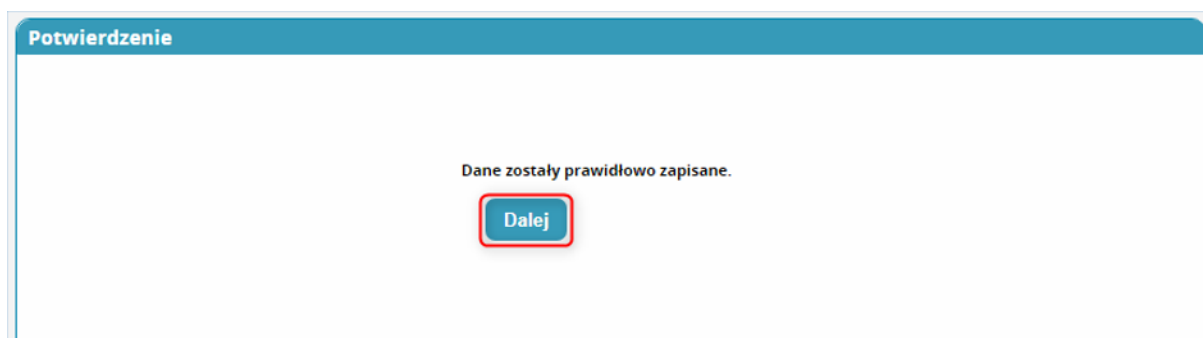
Rysunek 13 Potwierdzenie zapisania danych o usunięciu akceptacji dyżurów medycznych

Po użyciu przycisku „ Zapisz ” system zaprezentuje komunikat informujący o poprawności zapisu danych. Komunikat należy potwierdzić przyciskiem „ Dalej ”