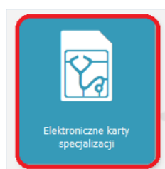
Rysunek 2 Kafelek Elektroniczne karty specjalizacji

Po zalogowaniu w odpowiedniej roli należy wybrać kafelek „ Elektroniczne karty specjalizacji ”.