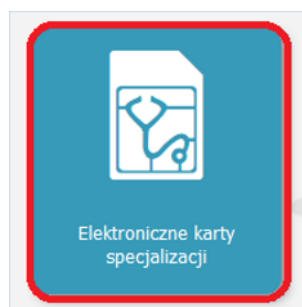
Rysunek 2 Kafelek Elektroniczne karty specjalizacji

Po zalogowaniu w odpowiedniej roli należy wybrać kafelek „ Elektroniczne karty specjalizacji ”.