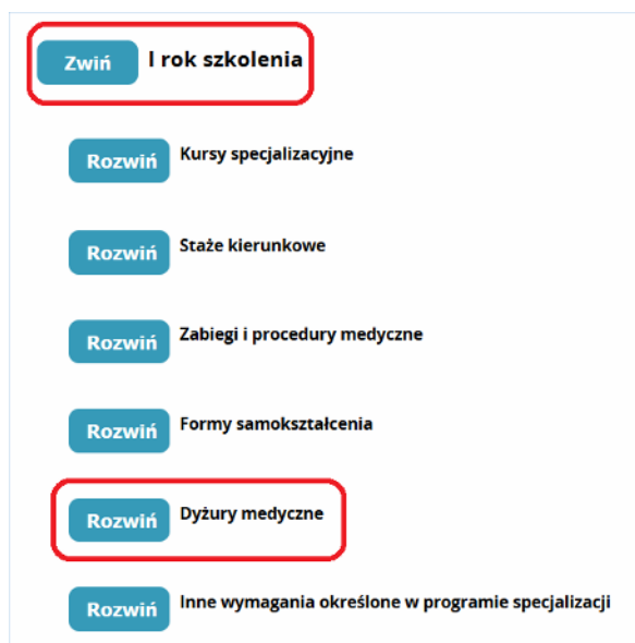
Rysunek 6 Wybór sekcji „Dyżury medyczne” dla wybranego roku szkolenia

Szczegóły sekcji „ Dyżury medyczne ” zostały podzielone na dwie części.