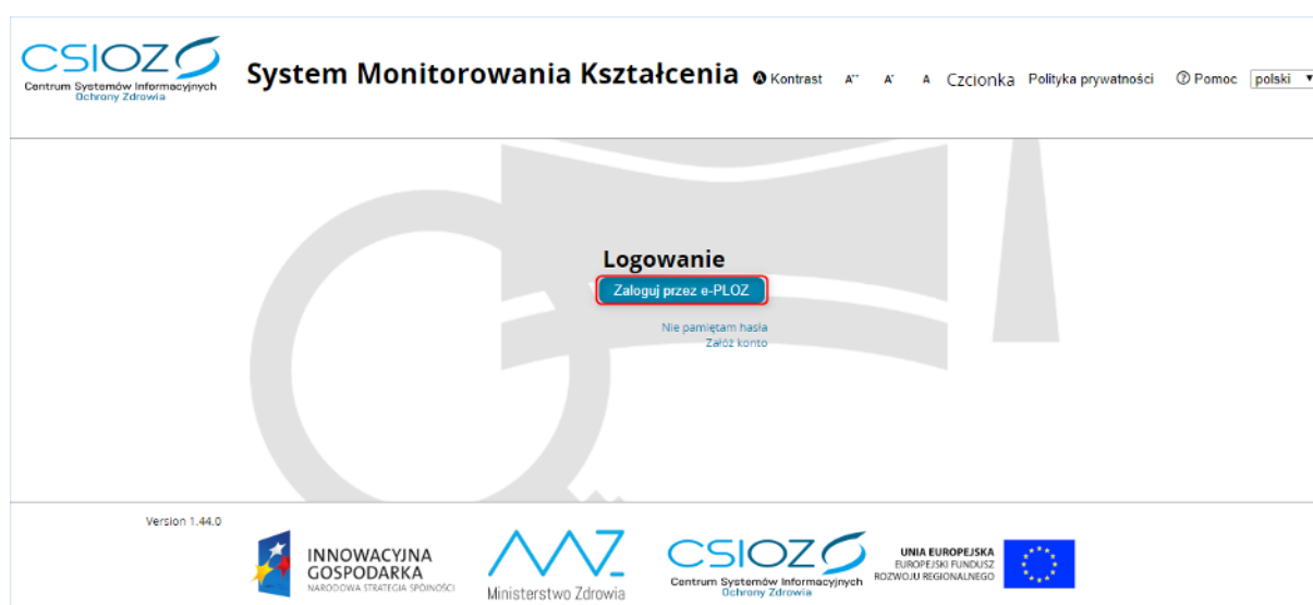
Rysunek 1 Logowanie do SMK

Aby rozpocząć proces akceptacji zrealizowanych dyżurów medycznych, należy przejść na stronę https://smk.ezdrowie.gov.pl , a następnie wybrać opcję „ Zaloguj przez e-PŁOZ ”.